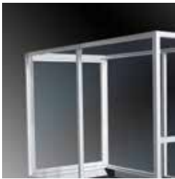
A richiesta: protezione Optional: protection guard